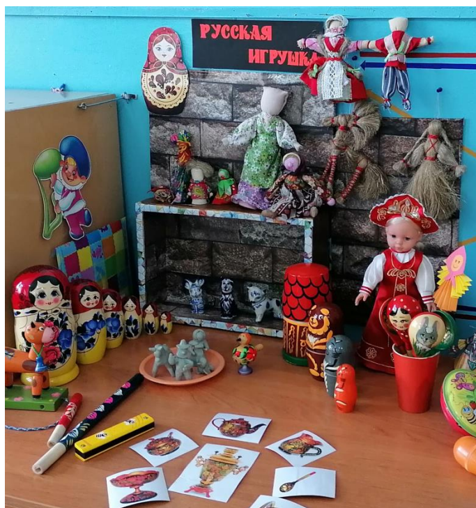
Мини-музей «Русская игрушка»