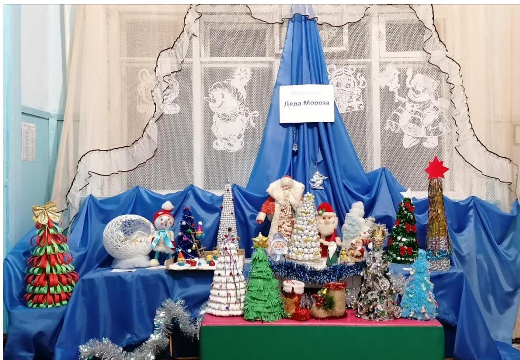
Мини-музей «Новогодней игрушки деда Мороза»