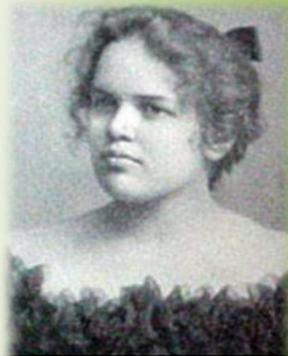
Adelaide Crapsey, creator of the American cinquain.

нерифмованная пятистрочная стихотворная форма, написанная по определенным правилам. В начале XX века форму синквейна разработала Аделаида Крепси, опиравшаяся на знакомство с японскими миниатюрами хайку и танку. Синквейны вошли в ее собрание стихотворений изданное в 1914 году.