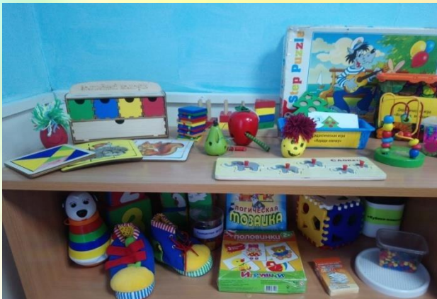
Центр сенсорного развития