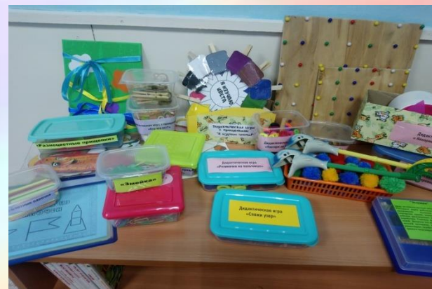
Центр моторного и конструктивного развития